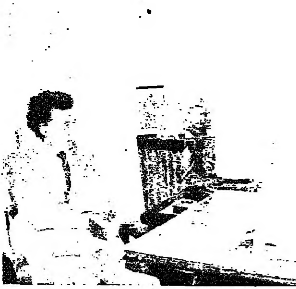
الإبراهيمي مع الوزير بزي